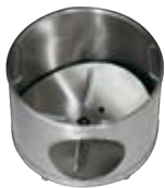
Wascheinsatz mit vier Bürsten Wash insert with four brushes