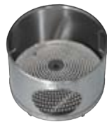
Wascheinsatz mit Bürsten Wash insert with brushes