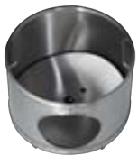
Wascheinsatz ohne Bürsten Wash insert without brushes