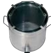
Edelstahl Stainless steel