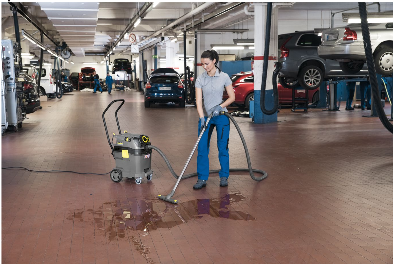
NT 40/1 Tact Te L