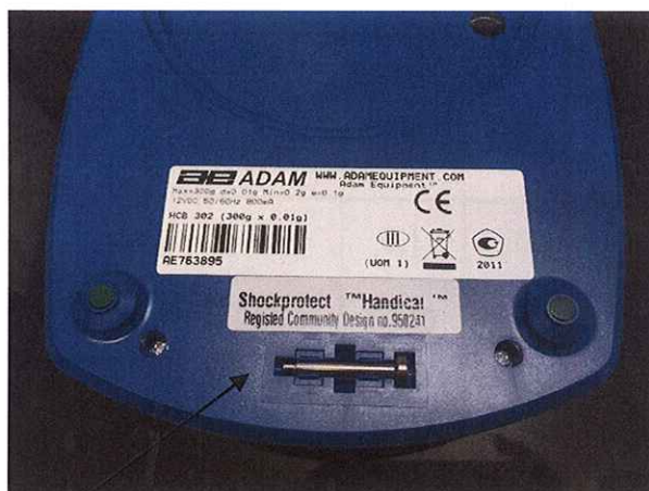
Рисунок 2 – Место нанесения свинцовой пломбы