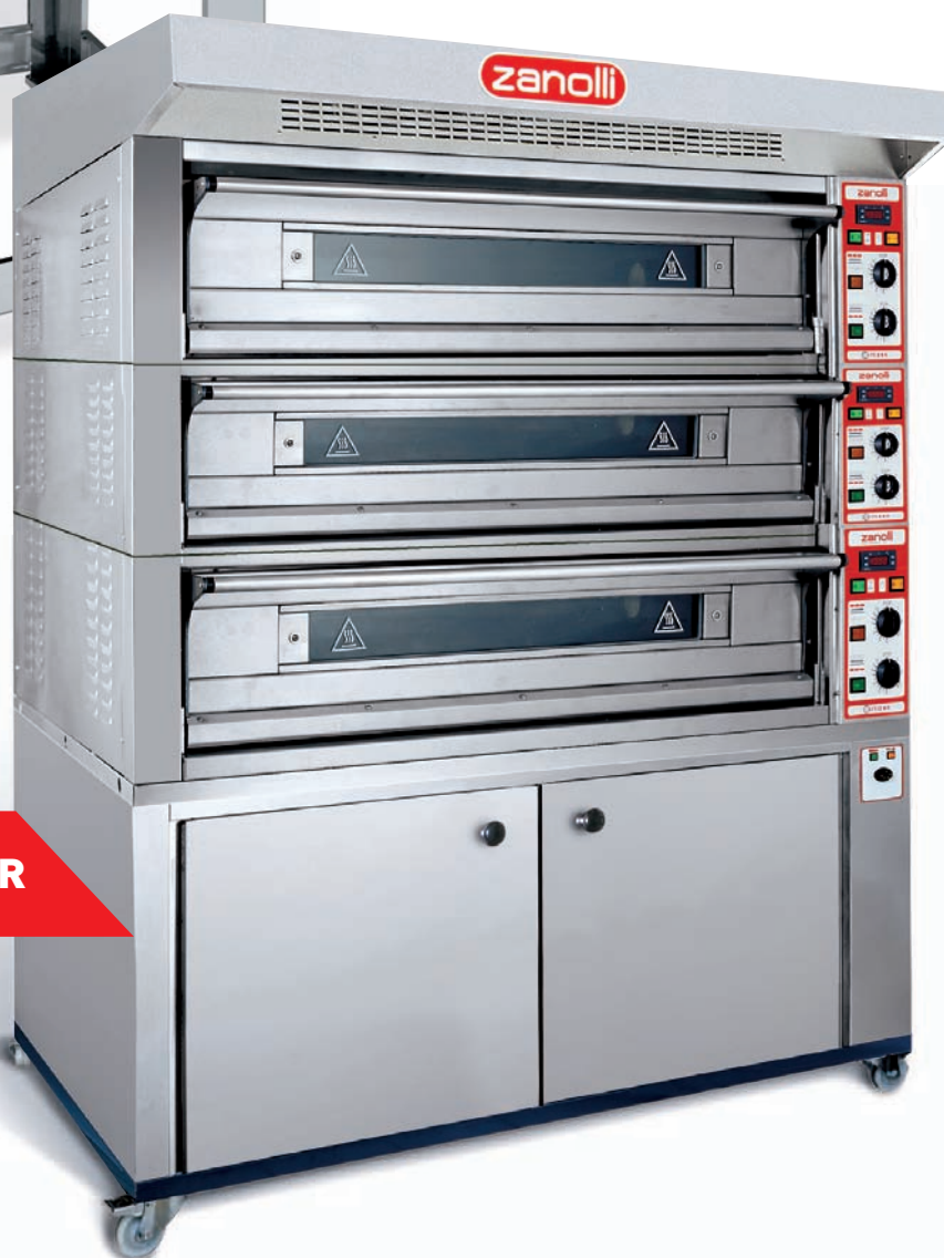
CITIZEN ELETTRICO MODULAR