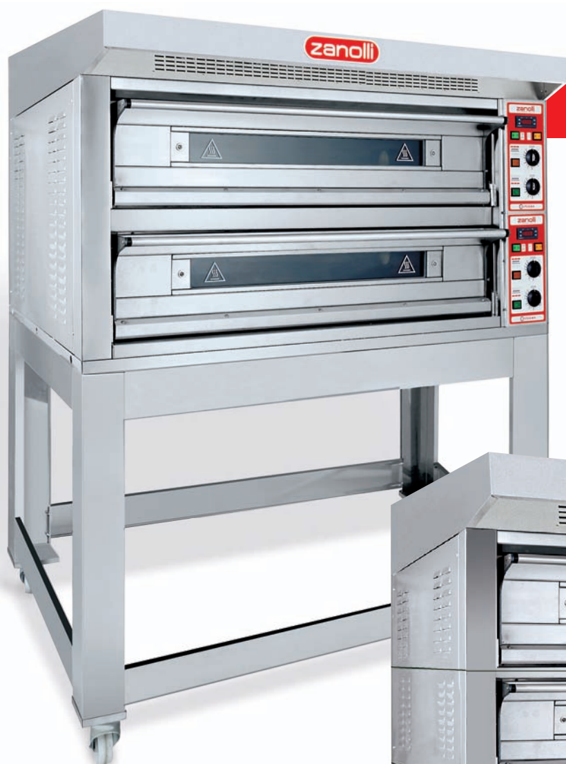
CITIZEN ELETTRICO BICAMERA