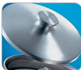
Opzionale: coperchio Optional: Lid