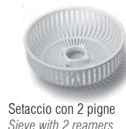
Setaccio con 2 pigne Sieve with 2 reamers