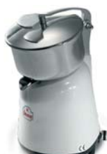
APOLLO CON LEVA VV