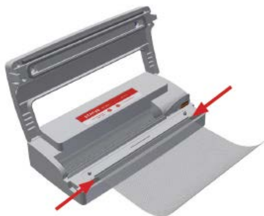
Рисунок 3: Поместите рулон на запечатывающую планку и растяните его до черной силиконовой прокладки, чтобы запечатать (см. стрелки).