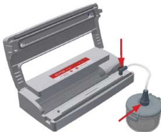
Рисунок 8: Вакуумная упаковка с использованием контейнеров

При вакуумной упаковке жидких продуктов (супов, соусов и т.д.) между поверхностью жидкости и крышкой необходимо оставить хотя бы 1,5 см.