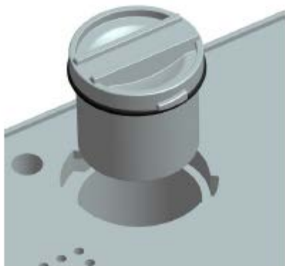
Рисунок 9: Контейнер для избыточной жидкости

В прибор встроен каплеуловитель. Он должен предотвращать серьезные повреждения при попадании жидкости из продуктов внутрь прибора. При необходимости каплеуловитель можно опорожнить.