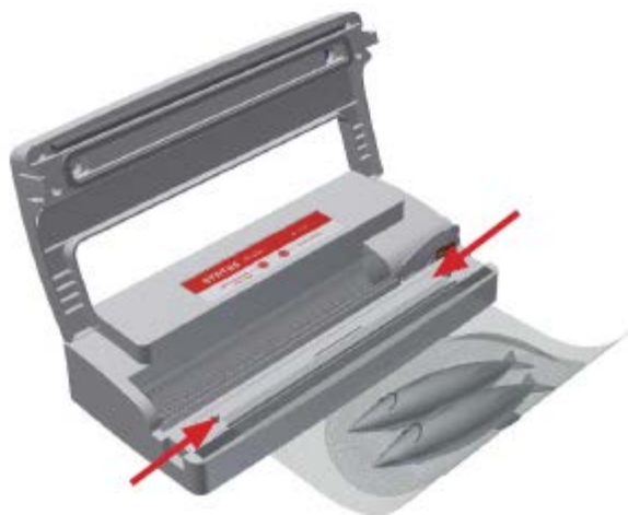
Рисунок 4: Поместите наполненный пакет в центр вакуумного отделения (между рельефной кольцевой линией - см. стрелки).

*РЕКОМЕНДАЦИЯ: При вакуумной упаковке жирных продуктов (в частности, бекона) настоятельно рекомендуем вывернуть наружные края пакета, поместить продукт внутрь и вывернуть края пакета обратно. Это предотвратит засаливание запаиваемых краев пакета.