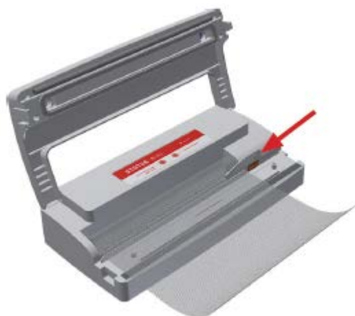
Рисунок 2: Разрежьте рулон с помощью прилагаемого ножа.