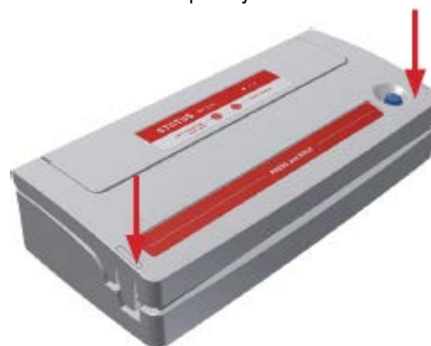
Рисунок 5: Закройте прибор: нажмите на края крышки (одновременно или по отдельности), так чтобы боковые фиксаторы вошли в пазы.