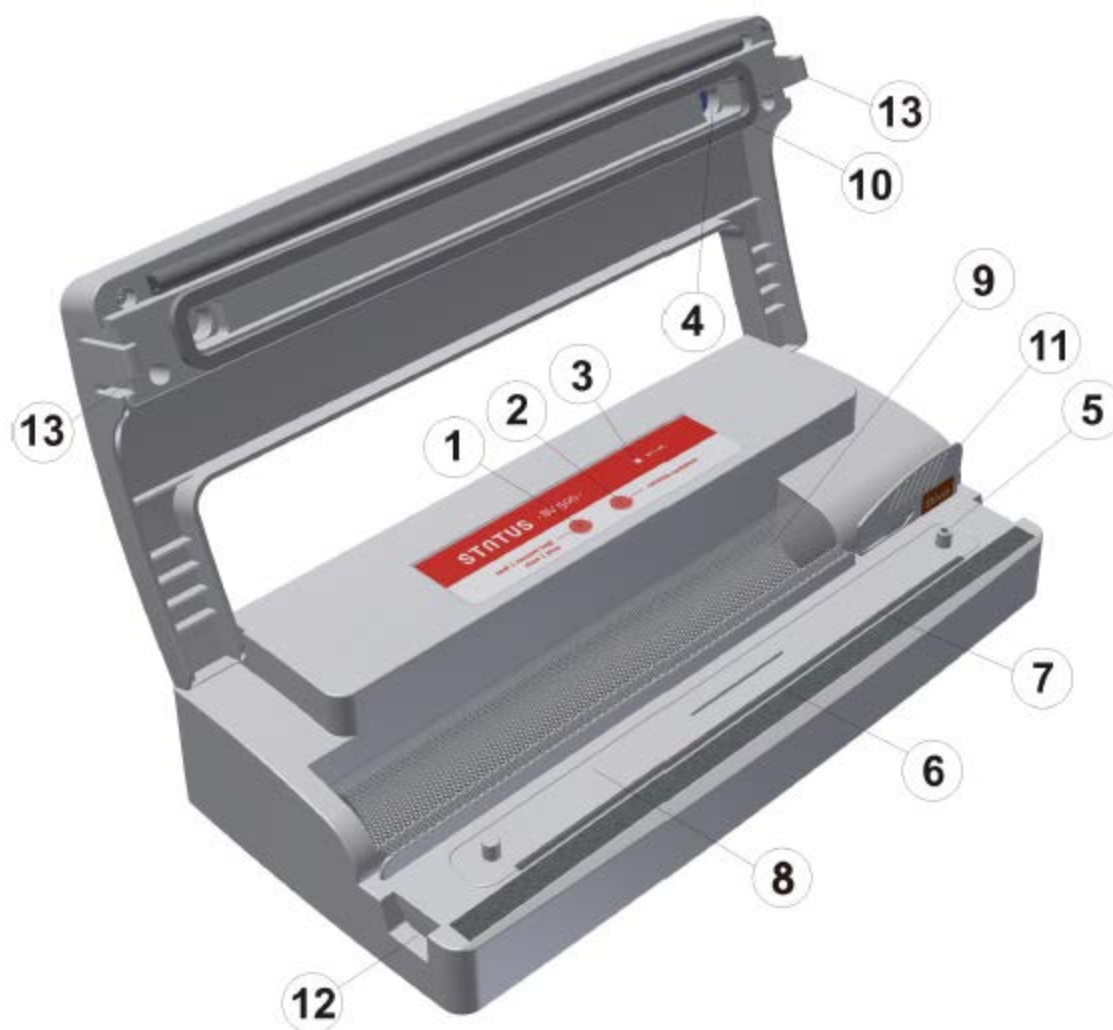
Рисунок 1: Status BV500 - компоненты отмечены номерами

На нижеприведенном рисунке представлен вакуумный упаковщик. Важные компоненты отмечены номерами и разьяснены в таблице.