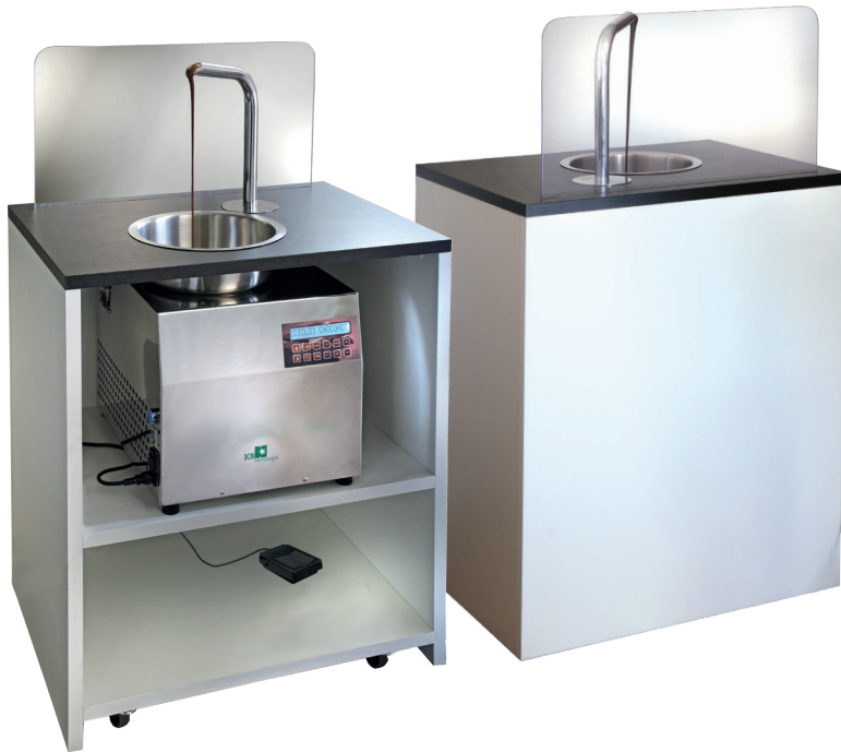
Kit da incasso per ChocoHot One Kit for building ChocoHot One in the counter 14.1.INCASSO