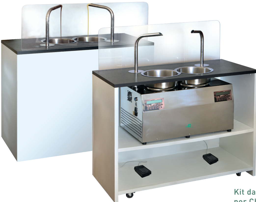
Kit da incasso per ChocoHot Two Kit for building ChocoHot Two in the counter 14.1.INCASSO2