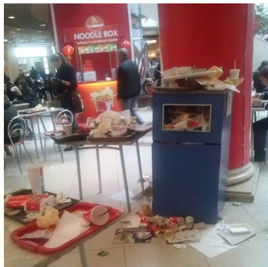
Неудобно обслуживать урну