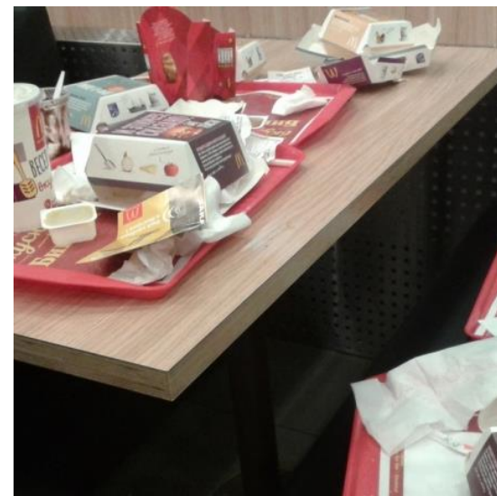
Брезгливое отношение клиентов к отходам