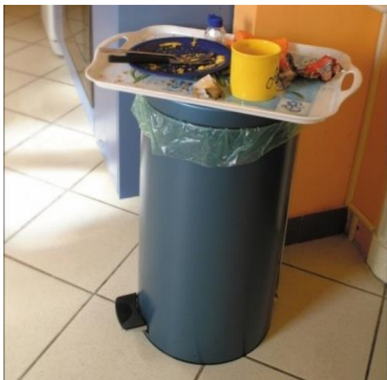
Неудобно выбрасывать мусор