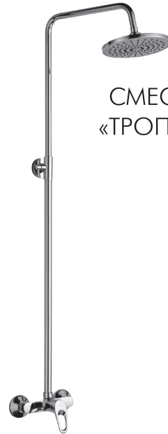
СМЕСИТЕЛЬ ДЛЯ ДУША «ТРОПИЧЕСКИЙ ДОЖДЬ»

В комплекте к смесителю прилагается паспорт изделия и гарантийный талон.