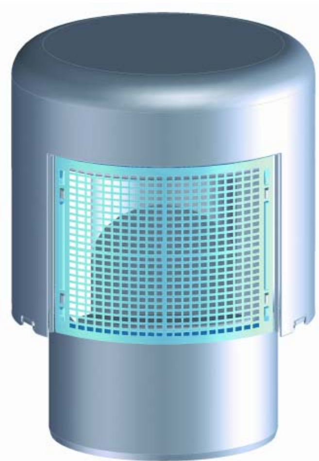
HL 900N (NECO)