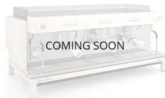
EX3 3GR КНОПЧНОЕ УПРАВЛЕНИЕ