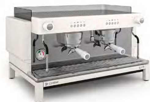
EX3 2GR КНОПЧНОЕ УПРАВЛЕНИЕ