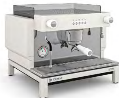
EX3 MINI 1GR КНОПЧНОЕ УПРАВЛЕНИЕ