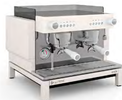
EX3 MINI 2GR КНОПЧНОЕ УПРАВЛЕНИЕ