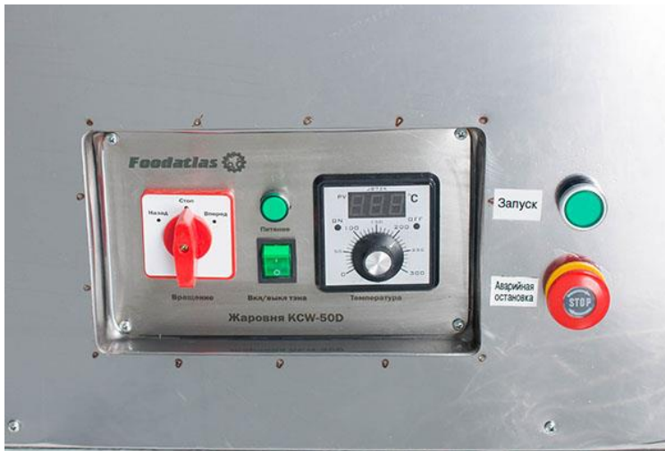
Рис2. Панель управления. основные органы управления оборудованием