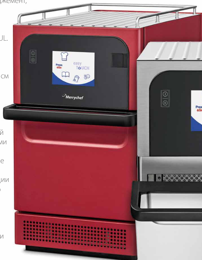
eikon® e2s Trend