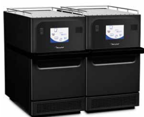
Адаптер для eikon® e2s Twin