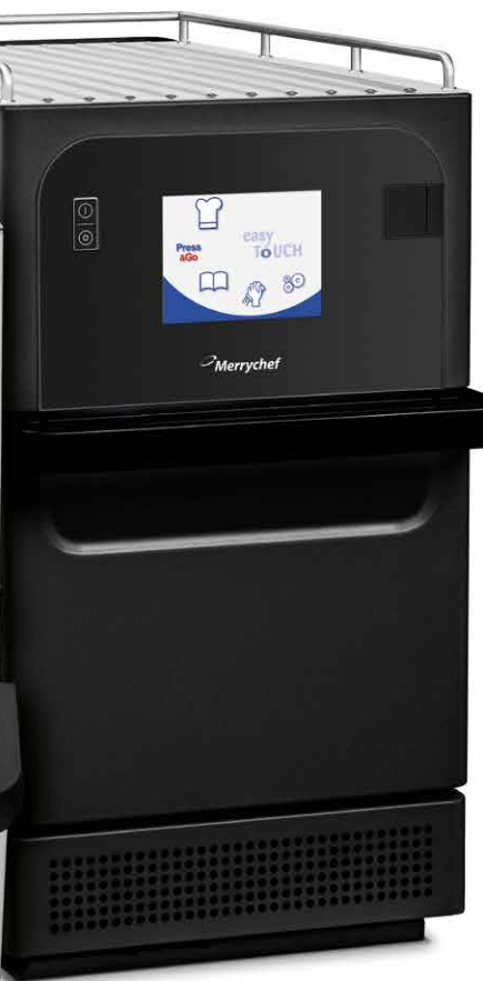
eikon® e2s Trend