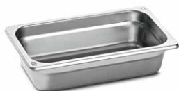
Поддон для охлаждения