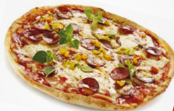
Пицца 50 с