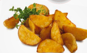
Клинья 60 с