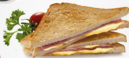
Горячий бутерброд 40 с