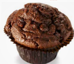
Разогретый маффин 30 с