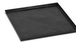
Противень со сплошным дном