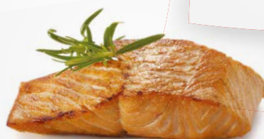
Стейк из лосося 70 с