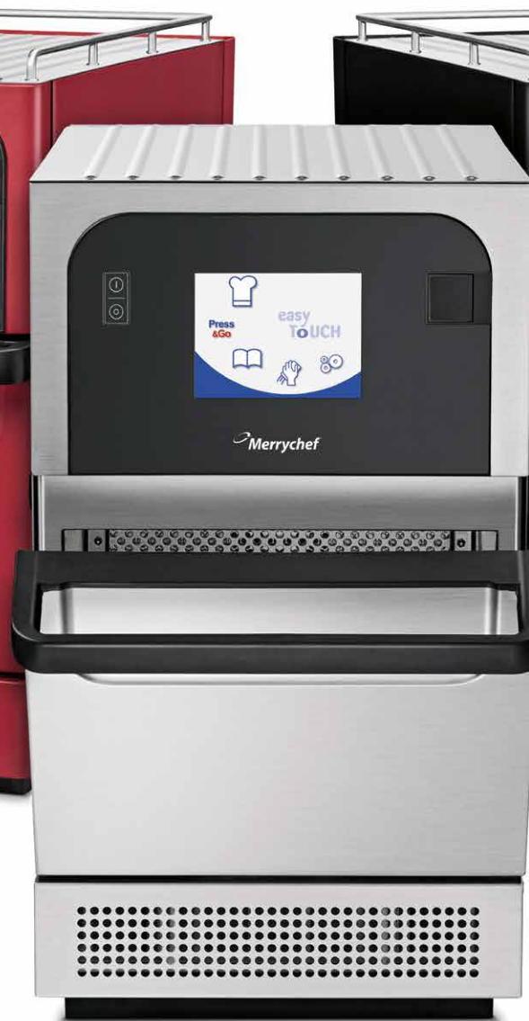
eikon® e2s Classic