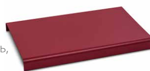
Демо-панель для презентации блюд