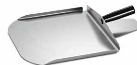
Лопатка с защитой с поддерживающими боковыми стенками