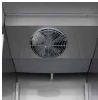
Крышка испарителя из нержавеющей стали