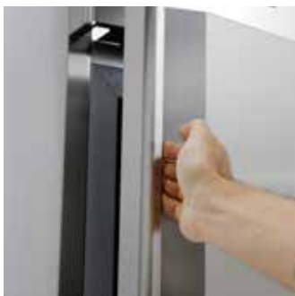
Эргономичная ручка из нержавеющей стали толщиной 2 мм

Остановка вентиляторов при открытии двери снижает перепады температур и, следовательно, увеличивает срок эксплуатации компрессора.