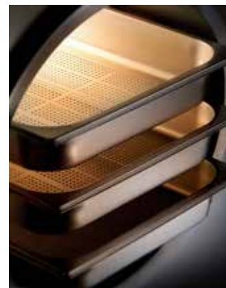
A Три уровня съемных направляющих для GN1/1