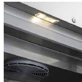
Лампа освещения в стандартной комплектации