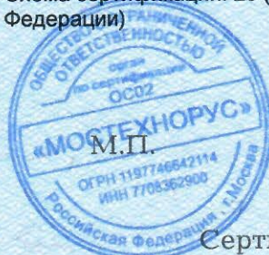
Схема сертификации: 2с (ГОСТ Р 53603-2020 Оценка соответствия. Схемы сертификации продукции в Российской Федерации)