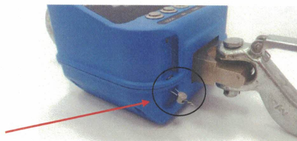
Рисунок 4 – Схема пломбировки от несанкционированного доступа и место нанесения знака поверки

2) Для защиты от несанкционированной настройки и вмешательства, которые могут привести к искажению результатов измерений, весы пломбируются.