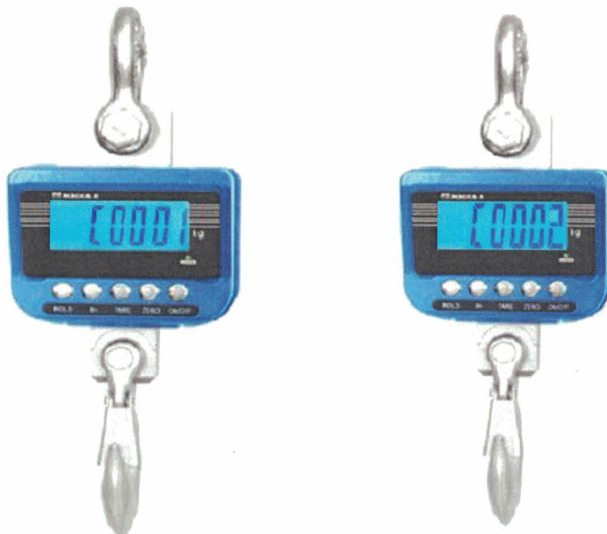
Рисунок 3 – Индикация кода юстировки

Процедура проверки показаний счетчика: после включения весов на индикаторе отображается версия программного обеспечения, максимальная нагрузка весов, затем высвечивается код юстировки.