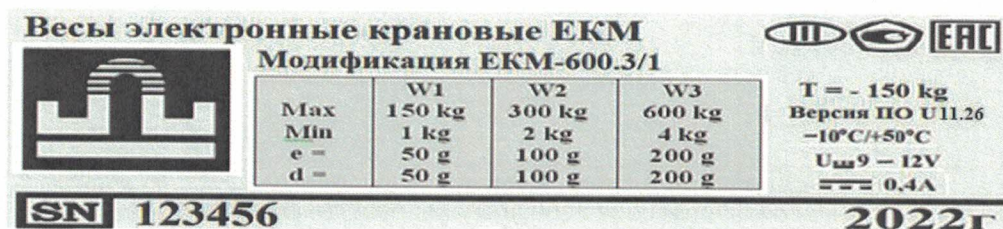
Рисунок 2 – Маркировка весов

Маркировка весов производится на разрушаемой при удалении фирменной наклейке, на которой нанесено: