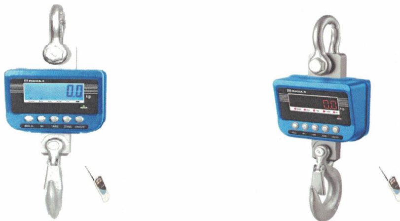
а) ЖК блок индикации