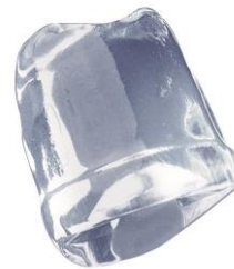
18 gr. FULL ICE CUBE