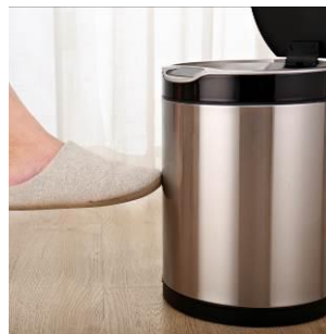
Рис. Датчик удара. Реализован как дополнительная функция открытия верхней крышки без использования рук. Удар может быть произведен ногой, и нет в необходимости в сильном ударе, достаточно лишь легкого прикосновения в середину корпуса мусорного ведра.

*Модель JAN9313, JAN9314- без внутреннего ведра