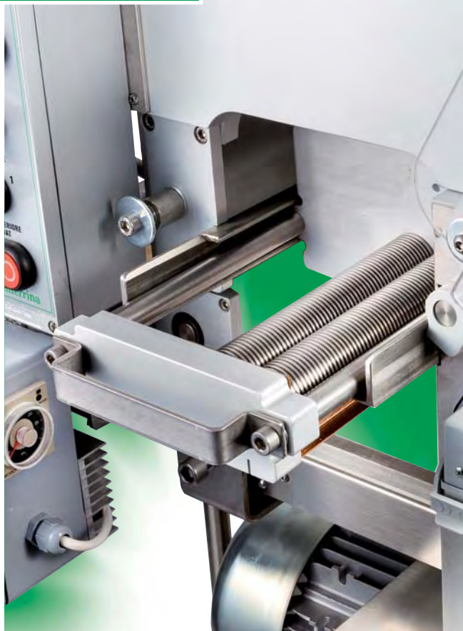
Taglio automatico tagliatelle