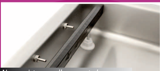
Nuovo sistema sollevamento barra