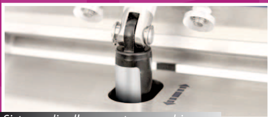
Sistema di sollevamento coperchio