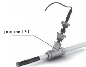
Рис. 4 - Схема ввода нагревательной секции внутрь трубопровода под углом 120°