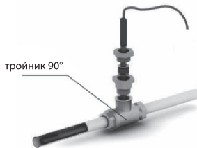
Рис. 3 - Схема ввода нагревательной секции внутрь трубопровода под углом 90°