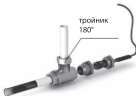
Рис. 2 - Схема прямого ввода нагревательной секции внутрь трубопровода

По данному QR-коду Вы сможете перейти на страницу сайта-производителя и приобрести сальниковый узел.