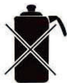
Чайник из алюминия и меди