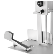
Alimentary plastic blade scraper in quick to insert. Hermetic upper pulley Watertight black plastic flange to protect the