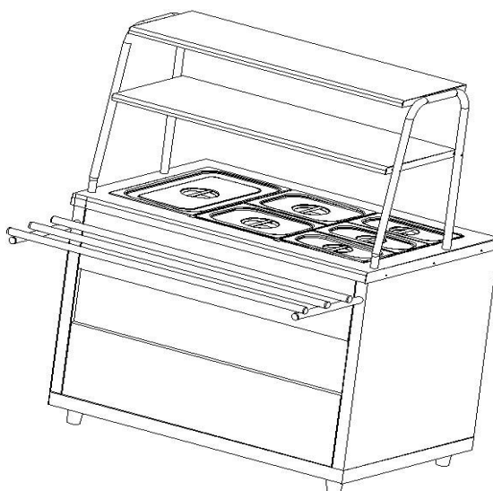
Рис.1 Общий вид мармита МЭП-2Б/ЛП-01 и МЭП-2Б/ЛПЭ

Общий вид мармита представлен на рис. 1. В серии «Ли́ра-Профи» корпус мармита изготовлен из нержавеющей стали, в серии «Ли́ра-Профи Э́ко» отдельные элементы изготовлены из окрашенной оцинкованной стали. В столешницу мармита встроена прямоугольная ванна с электронагревательными элементами.