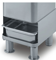
Optional trestle with sieve