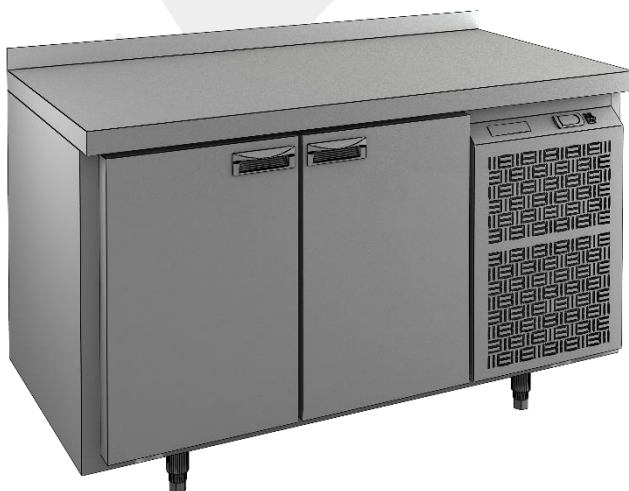
Рис.1 Стол охлаждаемый 2х дверный GN 11 TN