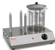
Hot Dog 3 Y09