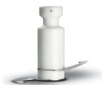
Shaft with knives to mix dough