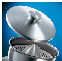
Lid - optional