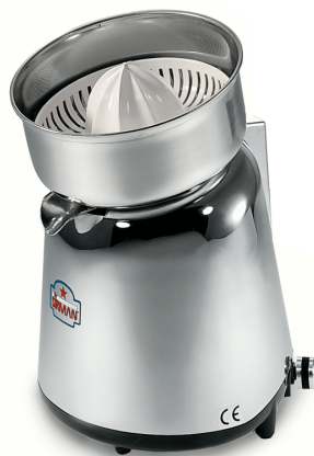
Sirman Соковыжималки , model Apollo :

Sirman Spa Viale dell'Industria 9/11 35010 PIEVE DI CURTAROLO (PD), Italy Tel./Fax. +39 049 9698666 / +39 049 9698688 email: info@sirman.com