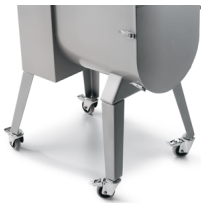
Optional legs with wheels