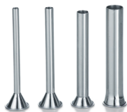
Funnels s/s ø 13-16-20-38 optional