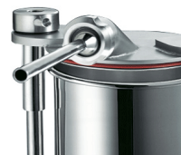
Bush in stainless steel, optional