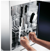
Knife storage unit removable