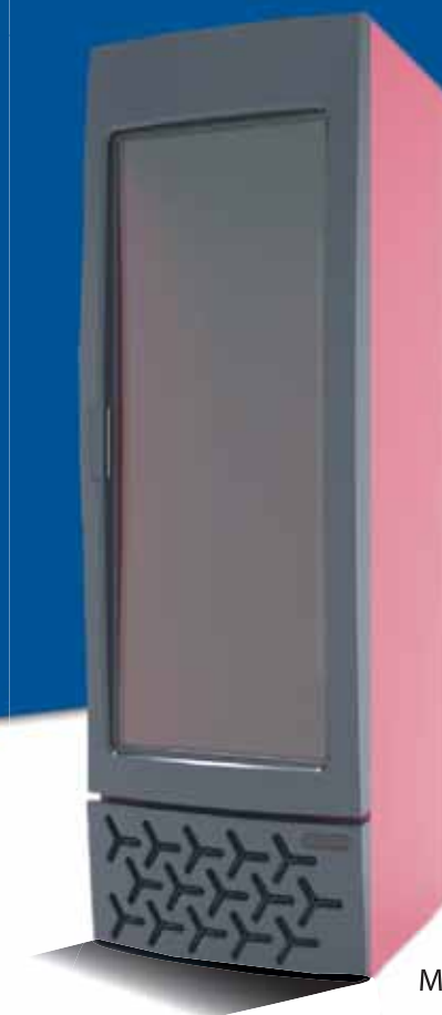
MIRA (CRF 300)