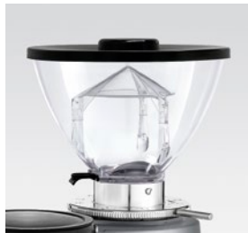
campana 500g / coffee bean hopper 500g