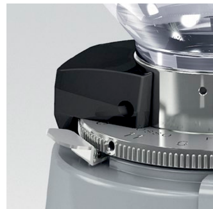
blocco ghiera - blocco campana ring nut lock - coffee bean hopper lock