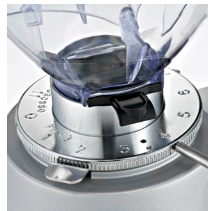
regolatore macinatura micrometrica micrometric grinding adjustment