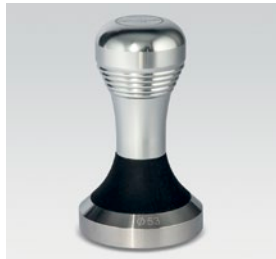
pressino in metallo / metallic tamper