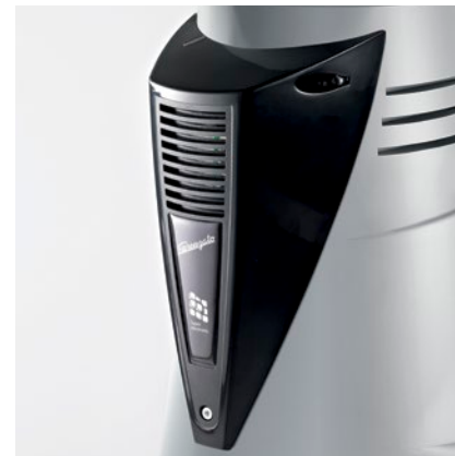
ventola di raffreddamento automatica automatic cooling fan