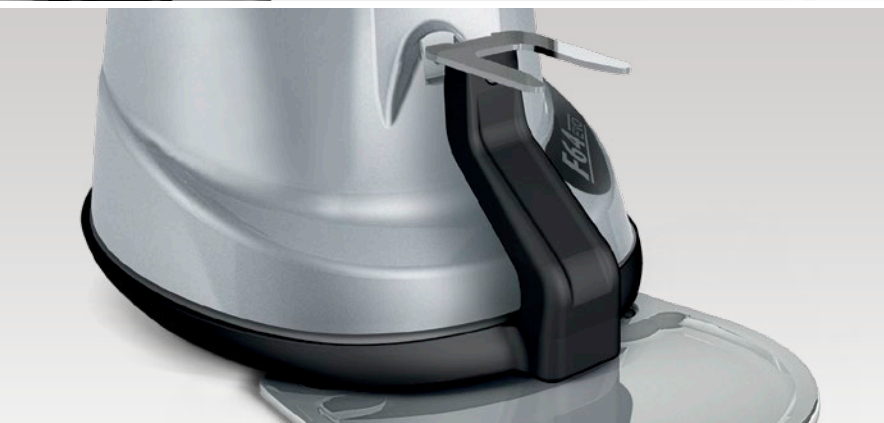
dispositivo per la taratura e la pesatura della dose di caffè device used to calibrate and weigh the dose of coffee

Thanks to the innovative patent of the XGi coffee grinder, the quantity of coffee dispensed, calculated in grams and set ONLY ONCE , will not change, guaranteeing precise doses and avoiding any waste.