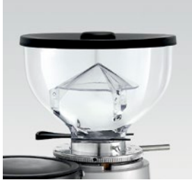
campana 250g / coffee bean hopper 250g