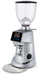
F64 E pag. 31