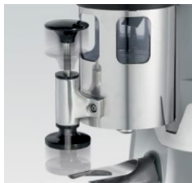
pressino telescopico / telescopic tamper