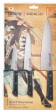
SHR-0220WO НАБОР ИЗ ТРЕХ НОЖЕЙ SHR-0011WO, SHR-0023WO, SHR-0085WO