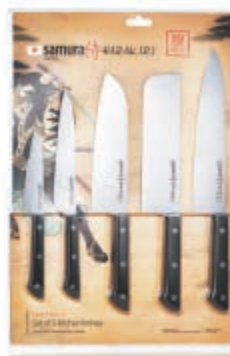
SHR-0250WO НАБОР ИЗ ПЯТИ НОЖЕЙ SHR-0011WO, SHR-0023WO, SHR-0043WO, SHR-0085WO, SHR-0095WO